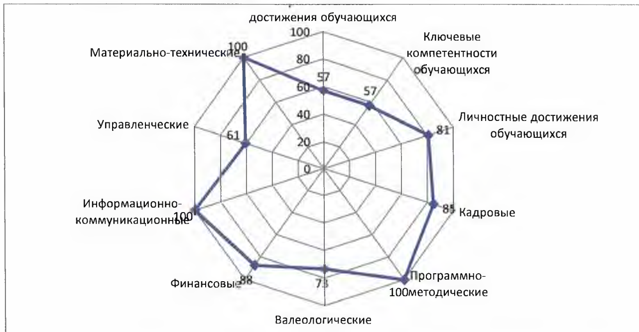
Рис.1. Графическое представление количественной оценки деятельности учреждения по параметрам