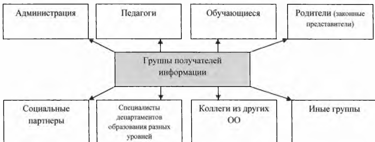
Рис.1. Получатели информации ВСОКО

Основными получателями информации являются лица, принимающие решения на разных уровнях управления системой образования, родители (законные представители), обучающиеся, общественность.